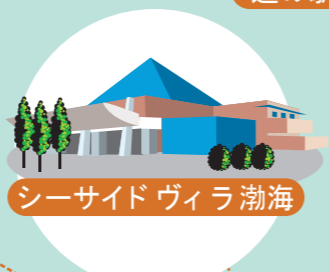
シーサイド ヴィラ 渤海