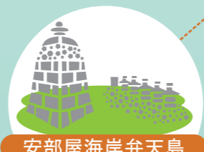
安部屋海岸弁天島