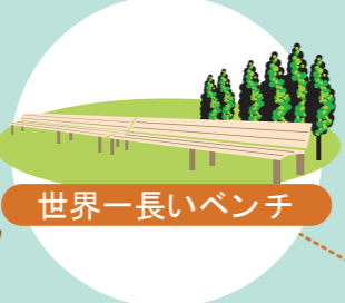
世界一長いベンチ