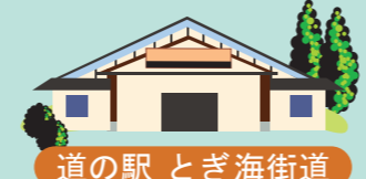
道の駅 とき海街道